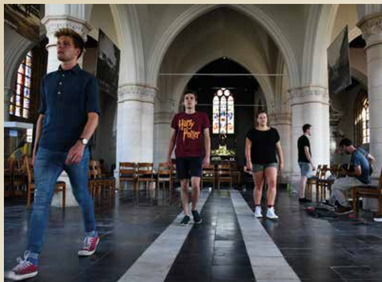
Volta repeteert volop in de kerk.